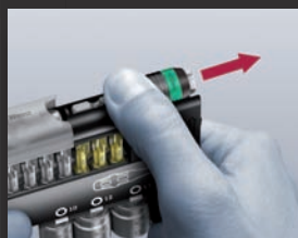
Wymywanie uchwytu Rapidaptor