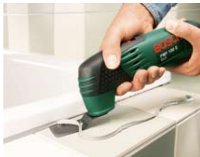
Usuwanie uszczelnień silikonowych.