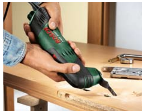
Dopasowywanie okuć w drzwiach.