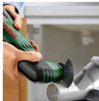
Skracanie rur odpływowych.