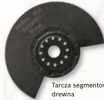
Tarcza segmentowa do drewna