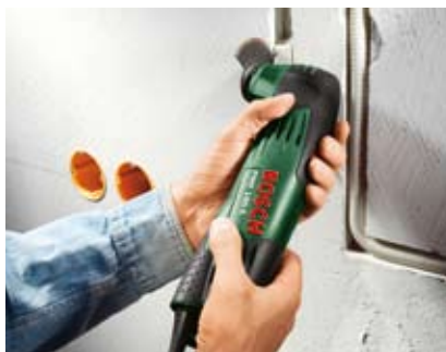
Wycinanie tunelu kablowego.