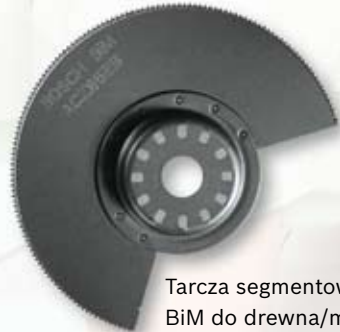
Tarcza segmentowa BiM do drewna/metalu

Tarcze segmentowe doprowadzą Cię szybciej do celu: dzięki nim można dosięgnąć obszarów niedostępnych dotychczas lub bardzo trudno dostępnych dla konwencjonalnych urządzeń.