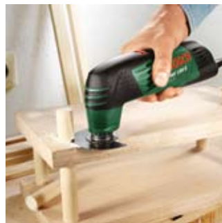
Usuwanie elementów drewnianych.