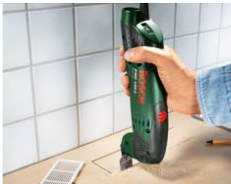
Wycinanie w blacie.