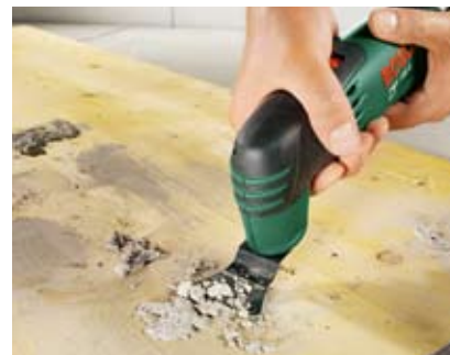
Usuwanie resztek betonu.