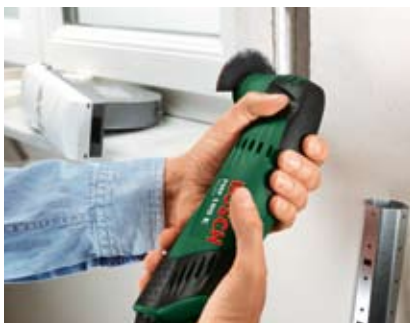
Frezowanie otworów w ścianach.