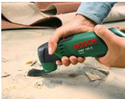
Usuwanie pozostałości po wykładzinach.