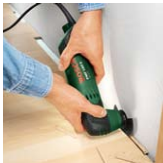
Odcinanie klepki parkietowej.

Krótkie i długie cięcia, w środku i na krawędzi materiału: dzięki urządzeniu PMF 180 E i tarczom segmentowym można ciąć szybko i łatwo. PMF 180 E przytnie parkiet, usunie wystające fragmenty drewna i przytnie rury do właściwej długości. A wszystko to bez większego wysiłku i z najwyższą precyzją.