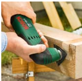
Tarnikowanie drewna na wiatę.

Papier ścierny trójkątny HM-Riff doskonale nadaje się do obróbki powierzchni. Dzięki nasadce szlifierskiej urządzenie PMF 180 E można wykorzystać także do szlifowania, a ponieważ PMF 180 E jest elektronarzędziem lekkim i poręcznym, bez wywierania dużej siły nacisku uzyskasz pożądany rezultat pracy. Problem emisji pyłu nie istnieje w przypadku PMF 180 E, ponieważ urządzenie posiada złącze do odkurzacza.