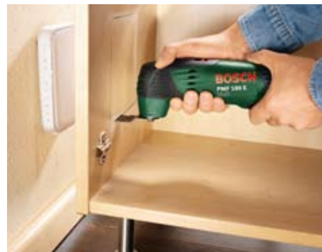
Wycinanie otworów w meblach.