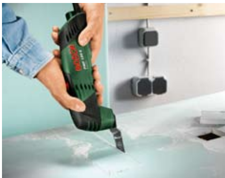
Wycinanie otworów w płycie gipsowo-kartonowej.