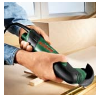
Przycinanie okuć metalowych.