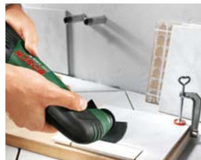
Cięcie płytek ściennych.