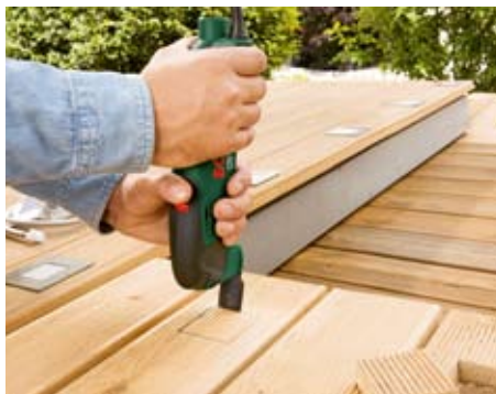
Wycinanie otworów w podłogach tarasowych.